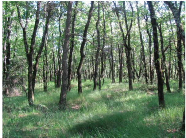
Parcours boisé (P. VARESE)

Validée en Comité de Pilotage du 21 novembre 2013