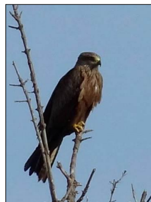
Milan noir