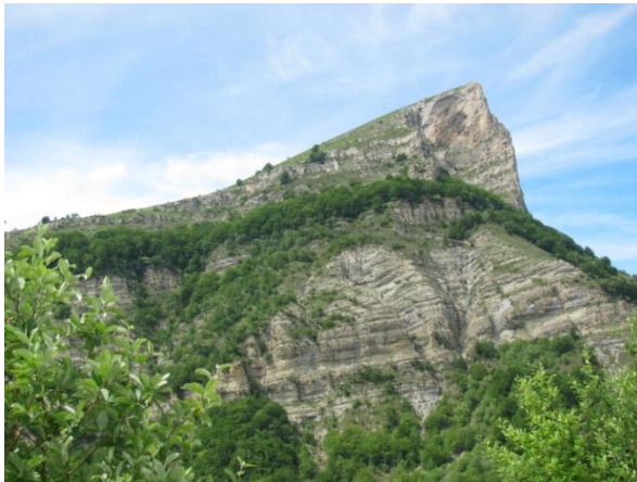
Vue sur les 3 becs