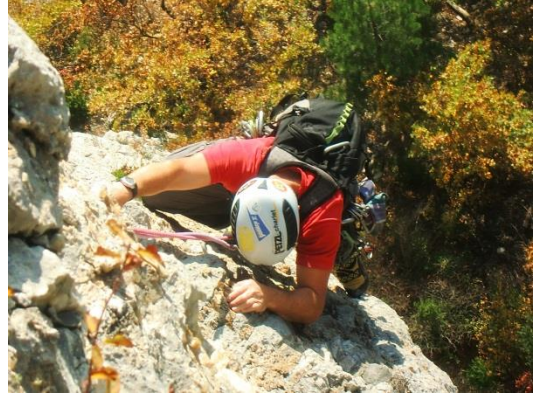
Saoû synclinal