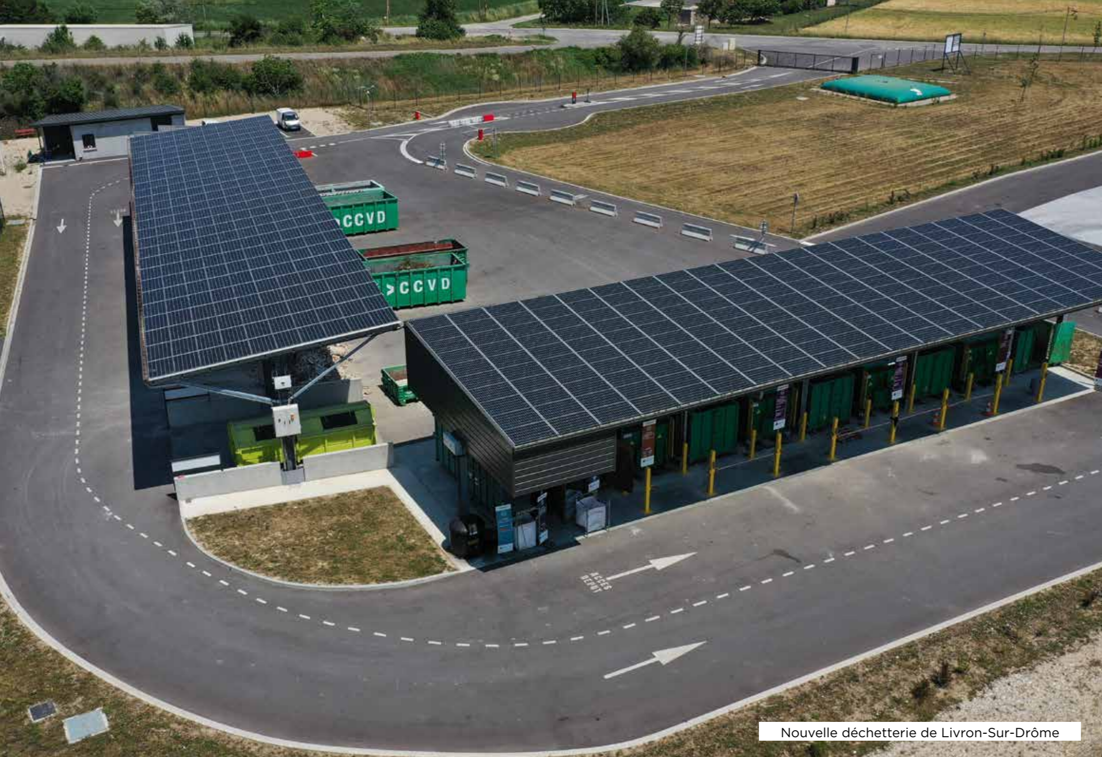
Nouvelle déchetterie de Livron-Sur-Drôme

Un service de collecte des déchets d'encombrants est également disponible pour les habitants ne pouvant se rendre en déchetterie (personnes seules et âgées, non véhiculées etc). Ce service passe par l'intermédiaire des Communes et fait intervenir la structure d'insertion Aire de Crest. En 2022, 17 Foyers en ont bénéficié et 24,5 m 3 de déchets collectés.