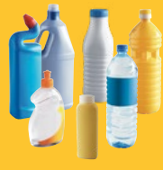
BOITEILLES ET FLACONS EN PLASTIQUE