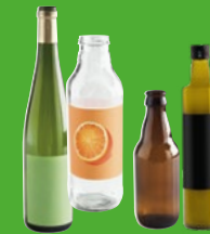
BOITEILLES EN VERRE