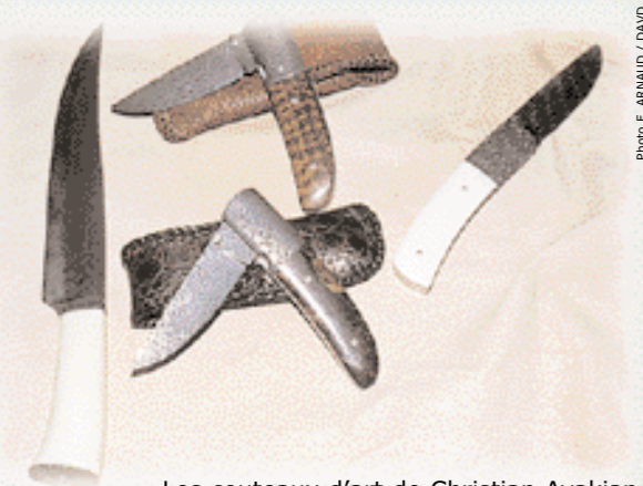
Les couteaux d'art de Christian Avakian