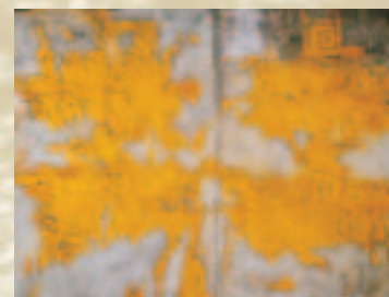
René SCHLOSSER "Sac Postal caviardé jaune"