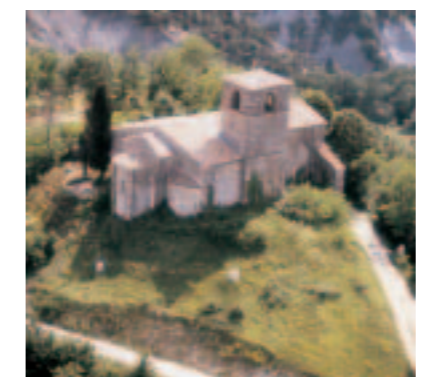
Gilles XUEREFF : église St-Pierre de Gigors

Prieuré de l'abbaye de Cluny, Saint-Pierre de Gigors apparaît dans les textes en 1169. Son histoire est connue à travers les notes que rédigeaient lors de leurs visites, les envoyés de l'Ordre. À la fin du XVI e siècle, le prieuré a disparu et l'église est en partie ruinée. Réparée à plusieurs reprises, l'édifice a subsisté grâce aux travaux réalisés à partir de 1871 par la mission du Diois, puis aux campagnes de restauration menées sous l'impulsion d'habitants de la vallée. Le livret entièrement consacré à l'église Saint-Pierre vous guidera lors de votre visite. Demander la clé de l'église à la mairie.