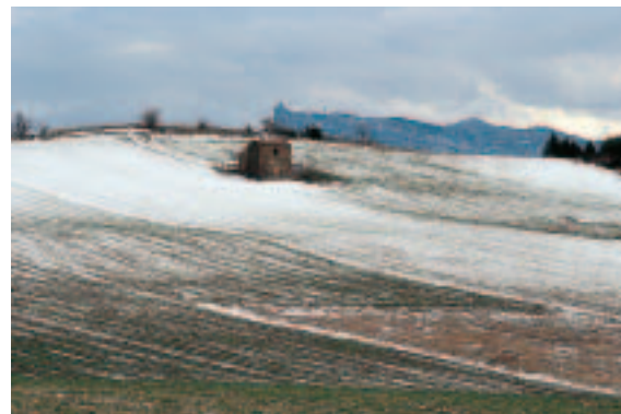
Bernard MOULIN : le plateau des Chaux

Assis face à l'église Saint-Pierre de Gigors, je goûte la douceur des derniers jours de Mars. La météo perturbée apporte ses "fenêtres" fugitives de ciel pur et lumineux. C'est le moment idéal pour admirer les crêtes se découpant, percevoir la matière des taillis de chênes qui ne perdront leurs feuilles brunes qu'à la nouvelle montée de sève. Moment pour se dire qu'on est bien dans ces hameaux abrités, alors que là-haut, sur les plateaux, c'est encore l'hiver.